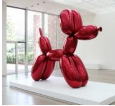
Acier inoxydable chromé Balloon dog/ Jeff Koons