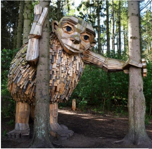
Bois - The 6 Forgotten Giants / Thomas Dambo