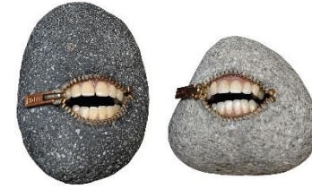
Pierre, métal, plastique - Ito Hirotschi, Laughing stones, - © Ito Hirotschi